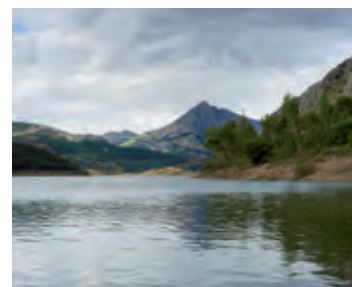
Pantano de Boñar. León.