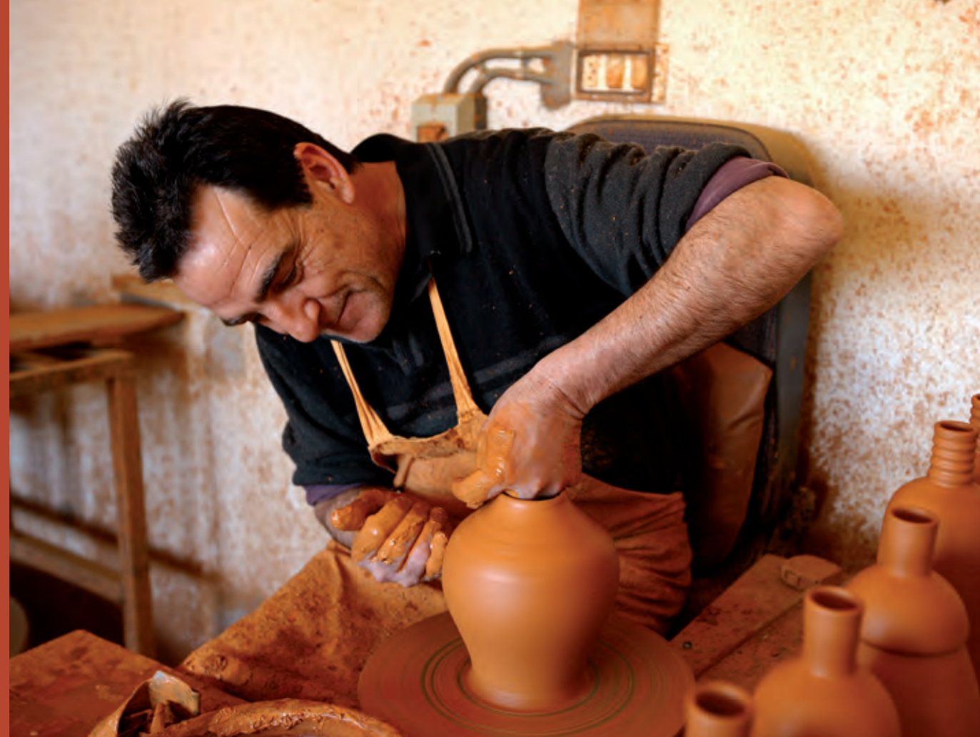
Alfarero en el taller.