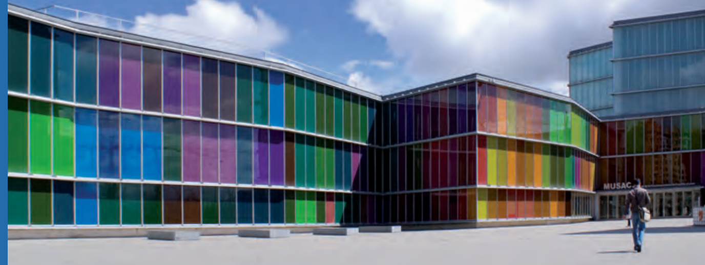
Museo de Arte Contemporáneo - MUSAC. León.

Las aulas arqueológicas que se reparten por Castilla y León son la mejor presentación de la riqueza arqueológica de la Comunidad.