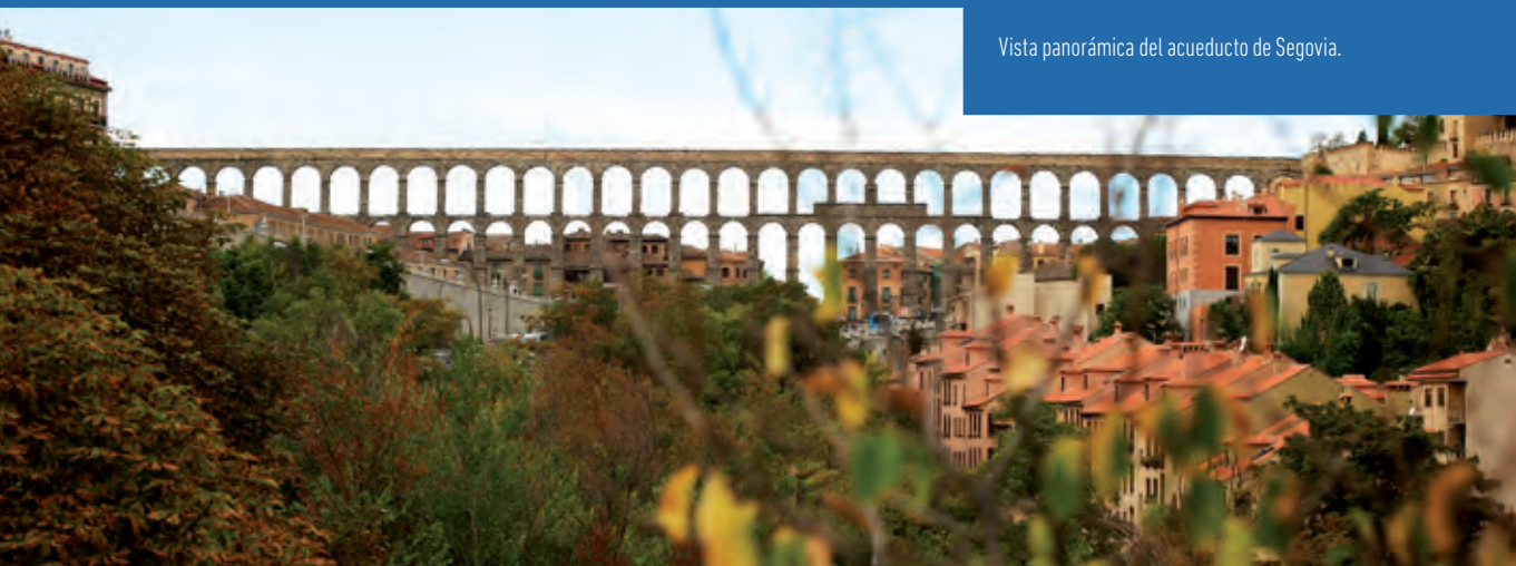
Vista panorámica del acueducto de Segovia.

religiosas y civiles, confieren a la ciudad un atractivo aspecto y su innegable valor cultural. En alguna de sus calles y edificios es aún posible percibir la convivencia de las culturas judía, musulmana y cristiana. Cada año la ciudad de Segovia celebra en sus calles una interesante muestra de actividades culturales y turísticas que atraen un buen número de visitantes.