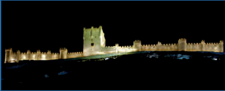
Castillo de Peñafiel

Actualmente, existen interesantes rutas que ayudan a descubrir su historia, arquitectura, y la importancia que tuvieron siglos atrás.