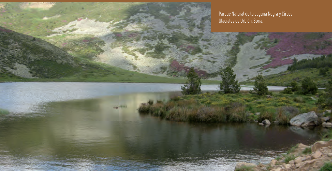
Parque Natural de la Laguna Negra y Circos Glaciales de Urbión. Soria.

Castilla y León tiene designado por la UNESCO el Geoparque de Las Loras, primer geoparque de Castilla y León, que ocupa parte de la zona norte de las provincias de Burgos y Palencia. Su patrimonio geológico en particular, junto con el resto del patrimonio natural y cultural le ha valido esta distinción.