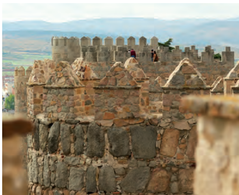
Las murallas de la ciudad de Ávila vistas desde las almenas.

Ávila cuenta con una muralla con 87 torreones y 2.000 almenas. Su principal tramo visitable, de 1.200 m, une la casa de las Carnicerías con el Puente Adaja.