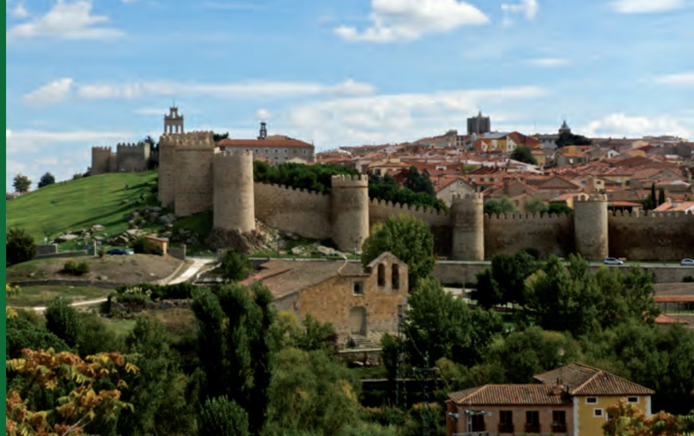
Vista panorámica de Ávila.

Cuatro aeropuertos y la inmediatez en el acceso al aeropuerto de Adolfo Suárez-Barajas completan las infraestructuras de una Comunidad bien comunicada con su entorno. La cordialidad y amabilidad de sus gentes han convertido a Castilla y León en una tierra abierta al resto del mundo tanto en el pasado como en el presente. Quien se acerca a estas tierras, es bien recibido y encuentra motivos sobrados para integrarse en una sociedad dinámica, rica y acogedora.