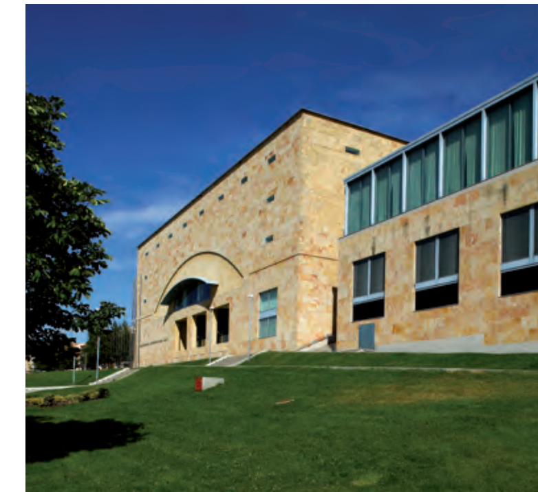
Palacio de congresos y exposiciones de Castilla y León. Salamanca.