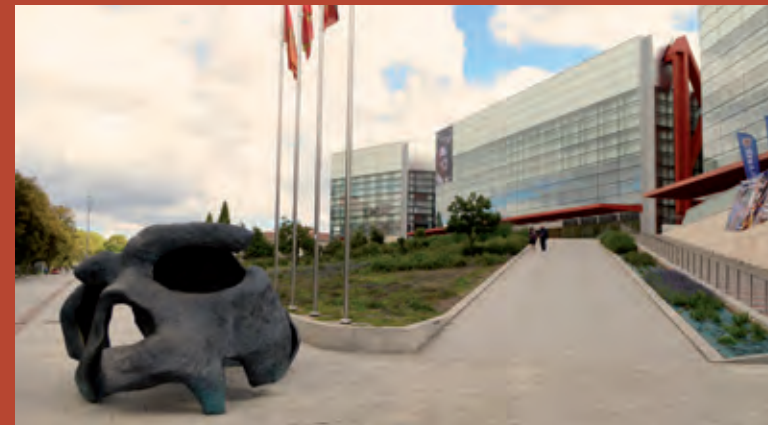
Entrada al Museo de la Evolución Humana.

Las principales ciudades de Castilla y León cuentan con infraestructuras públicas y privadas y disponen, además, de Oficinas de congresos que facilitan toda la información para la organización de los mismos.