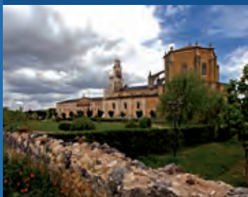
Monasterio de Santa María de la Vid (Burgos).

Los monasterios fueron antaño refugio de peregrinos, hoy reconvertidos en espacios donde el viajero puede encontrar el ambiente de religiosidad con el que fueron creados.