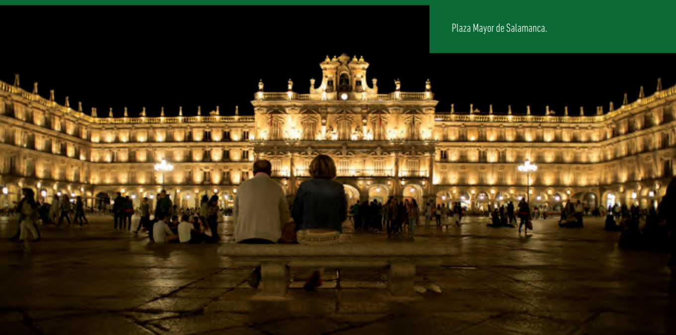
Plaza Mayor de Salamanca.

red nacional de ferrocarriles y por ella se desarrolla la mayor parte del tránsito ferroviario de la mitad norte de España. Además Castilla y León es el destino de España que tiene mayor número de ciudades conectadas con Madrid mediante trenes de alta velocidad.