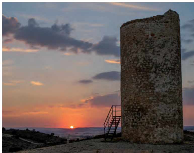
Vista panorámica de Segovia.

Atalaya defensiva musulmana de Quintanilla de los Barrios. Cerca de San Esteban de Gormaz. Soria.