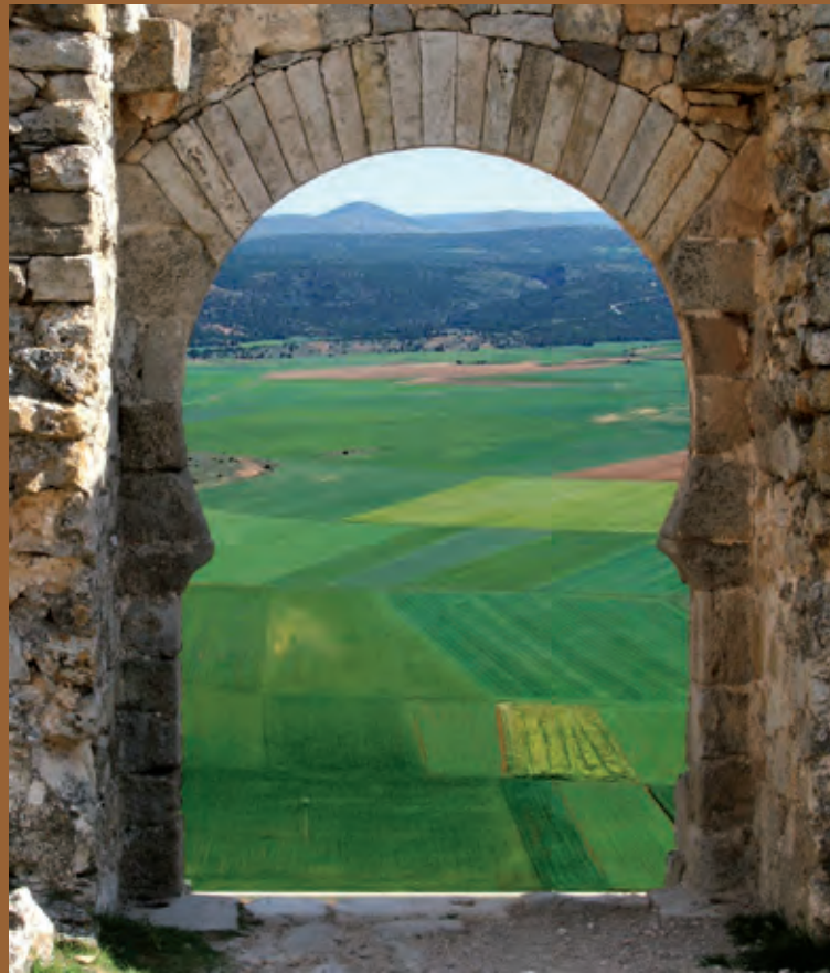
Puerta Califal del castillo de Gormaz, Soria.

Desde sus orígenes, este itinerario se ha identificado tradicionalmente con el recorrido seguido por el Cid en el Cantar, obra tomada como principal referencia a la hora de diseñar los trazados de la Ruta.