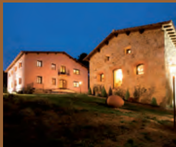
Posada del Infante Arenas de San Pedro (Ávila)

Castilla y León es la Comunidad Autónoma líder en turismo rural en número de establecimientos. Además, cuenta con una marca de calidad de los establecimientos de turismo rural denominada Posadas Reales que reúne a los mejores alojamientos rurales repartidos por los más bellos rincones de la Comunidad.