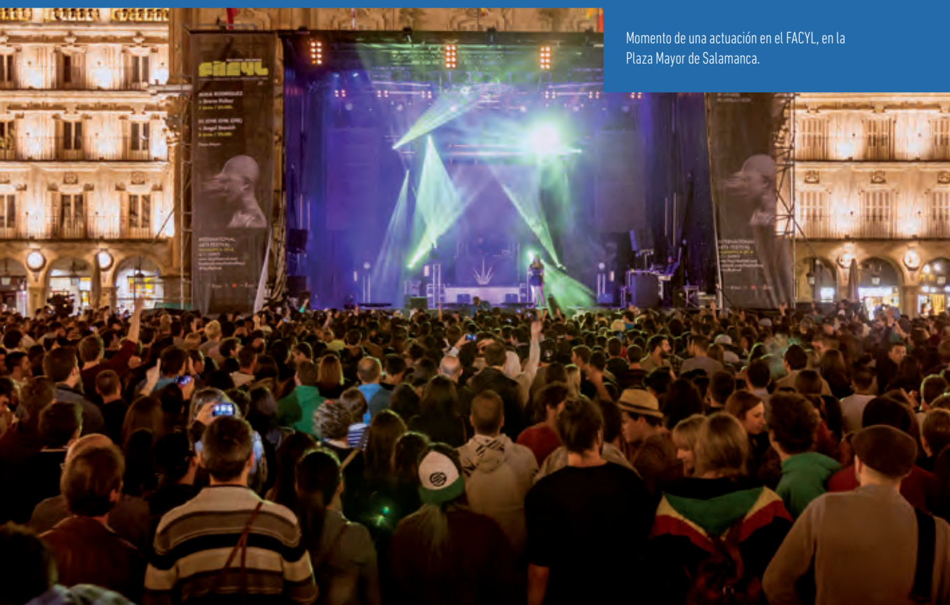
Momento de una actuación en el FACYL, en la Plaza Mayor de Salamanca.

Los escenarios de Facyl acogen espectáculos de hip hop, breakdance, danza contemporánea, circo, teatro o recitales de poesía. Todas las disciplinas artísticas tienen su espacio en el Festival.