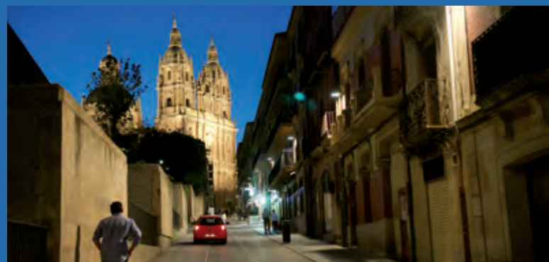
Calles de Salamanca con el edificio de la Clerecía (Universidad Pontificia) al fondo.

Es una de las cuatro más antiguas de Europa junto con Bolonia, Oxford y París. Su origen está en las escuelas catedralicias de época medieval, en el siglo XII y ya en el siglo XVII era considerada una universidad prestigiosa.