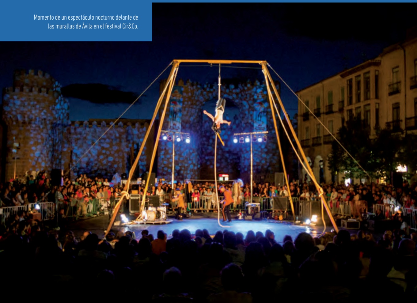
Momento de un espectáculo nocturno delante de las murallas de Ávila en el festival Cir&Co.

Semana Internacional de Cine de Valladolid. En octubre de cada año se celebra en Valladolid una muestra cinematográfica que se posiciona como uno de los principales festivales de cine internacional de España, destacando en el área del cine de autor e independiente y que ha ido evolucionando desde su creación en 1956 como Semana de Cine Religioso de Valladolid realizada durante la Semana Santa.