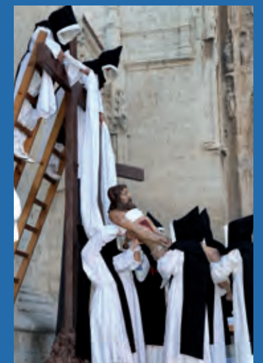
Semana Santa de Palencia.

religiosas, culturales y populares con mayor arraigo y atractivo turístico. Castilla y León es la Comunidad española que cuenta con mayor número de Semanas Santas declaradas de interés turístico internacional. Éstas son: Ávila, León, Medina del Campo, Medina de Rioseco, Palencia, Salamanca, Valladolid y Zamora.