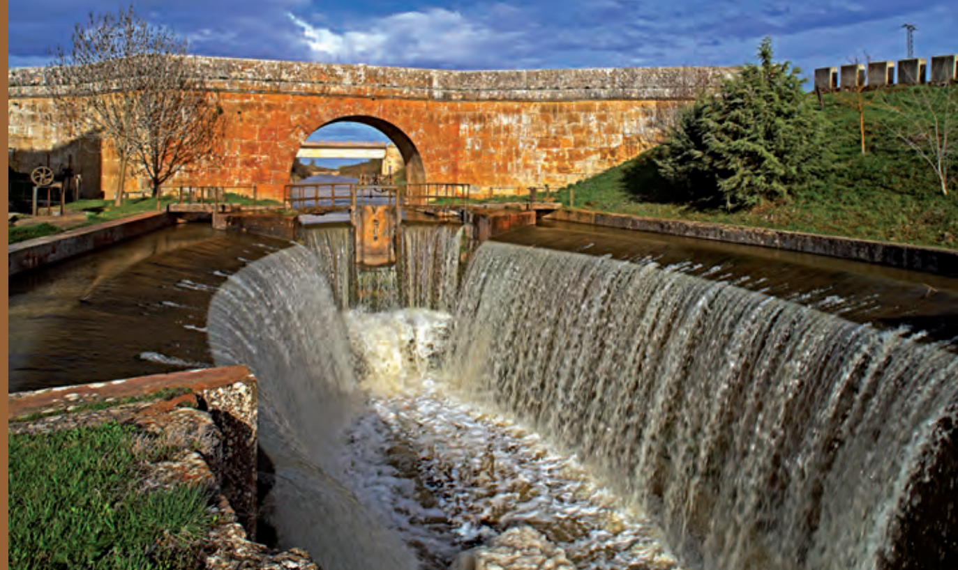
Esclusas 22, 23 y 24. Ramal Norte. Ribas de Campos. Palencia.

El río Tormes desde el mirador de los jardines de El Espolón. Alba de Tormes. Salamanca.