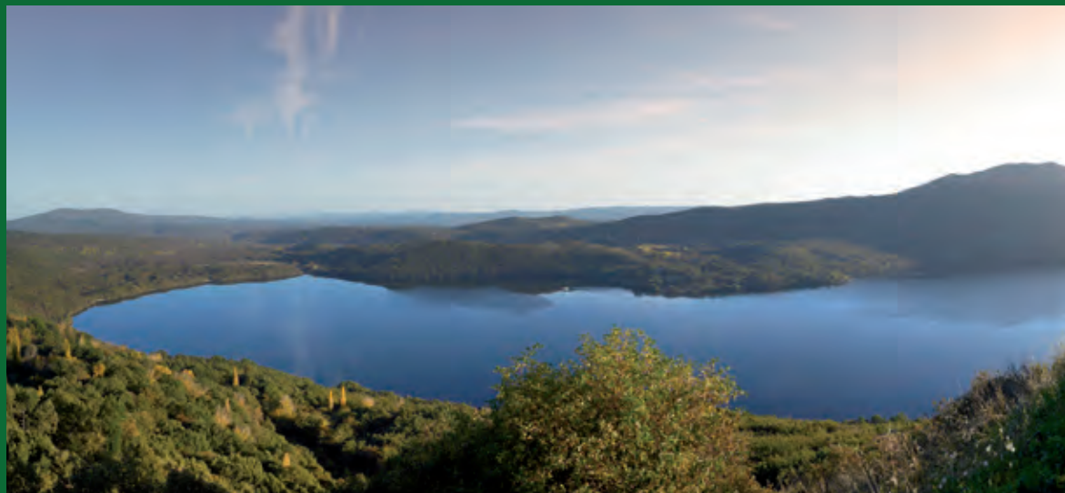
Lago de Sanabria, Zamora.