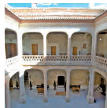
Posada Real Castillo del Buen Amor. Topas, Salamanca.