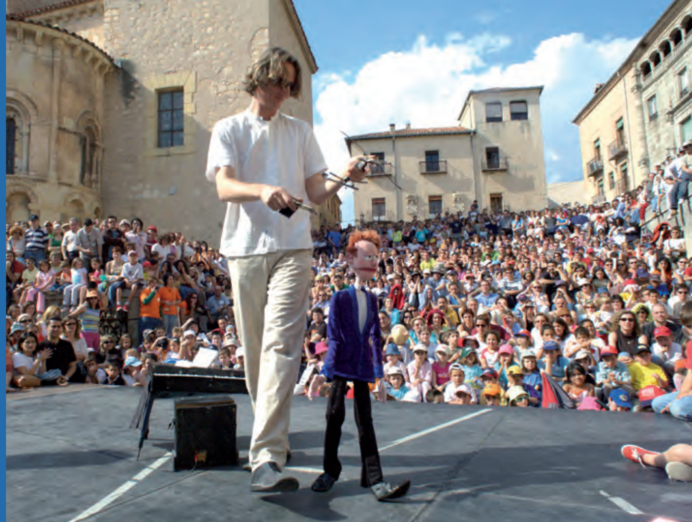
Actuación del Festival Titirimundi. Segovia.