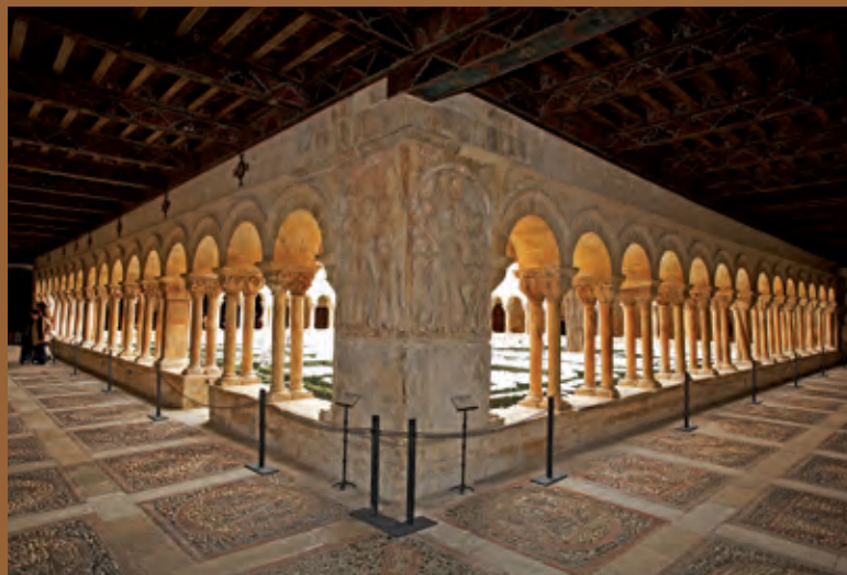
Claustro del Monasterio de Santo Domingo de Silos, Burgos.