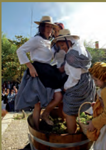
Celebración de la Fiesta de la Vendimia en Rueda, Valladolid.