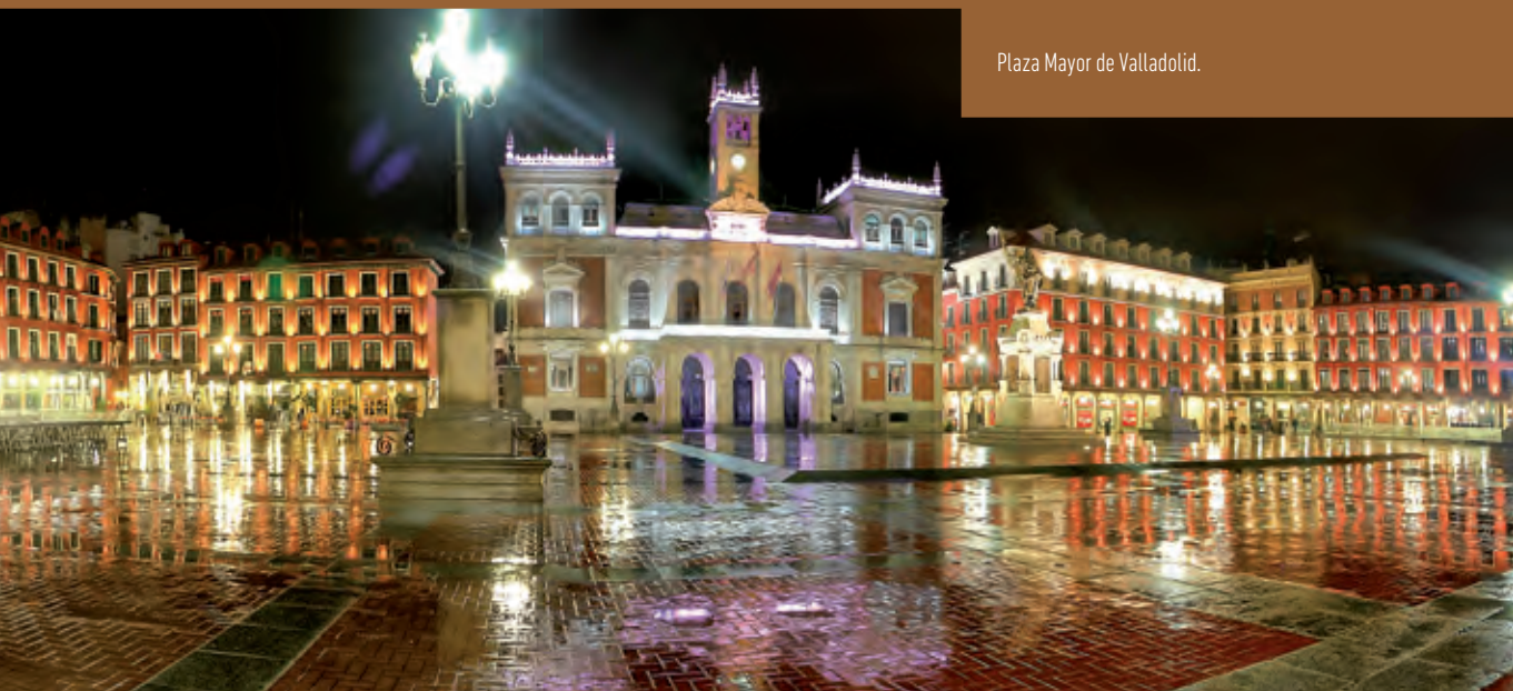
Plaza Mayor de Valladolid.

Santo Domingo de Silos tiene una vinculación directa con la historia del castellano ya que aquí se escribieron las Glosas Silenses, una de las primeras manifestaciones escritas en castellano.