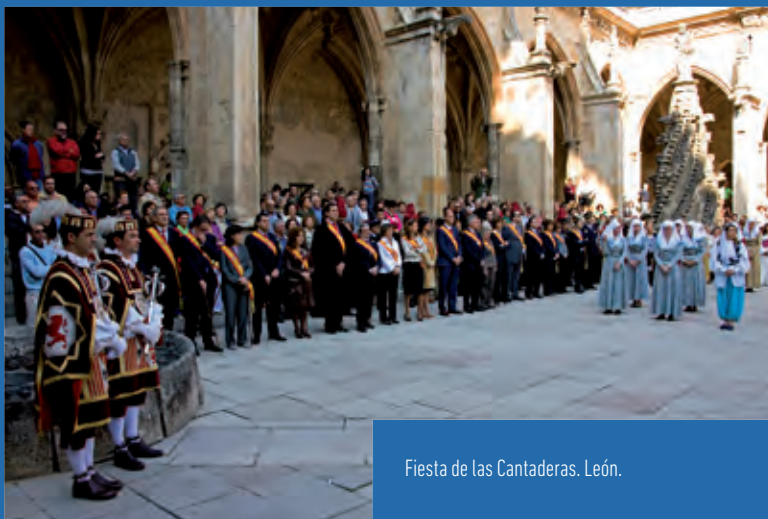
Fiesta de las Cantaderas. León.

Tradiciones y costumbres para el recuerdo, pero también para ser vividas y disfrutadas en el presente. Fiestas de la vendimia, encierros, romerías y desfiles, carnavales y mascaradas, justas medievales, música y bailes al ritmo de la dulzaina, del tambor y de otros instrumentos tradicionales y modernos inundan toda la geografía de la Comunidad.