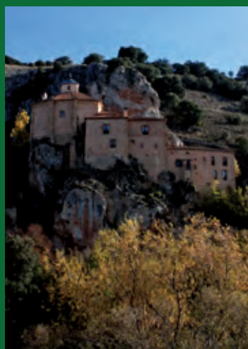
Ermita de San Saturio, Soria.

Castilla y León, cuna y residencia de ilustres personajes de la historia, ha sido para España y para Europa un ejemplo de respeto, convivencia, diálogo en la diversidad y de interculturalidad a lo largo de sus siglos de historia.