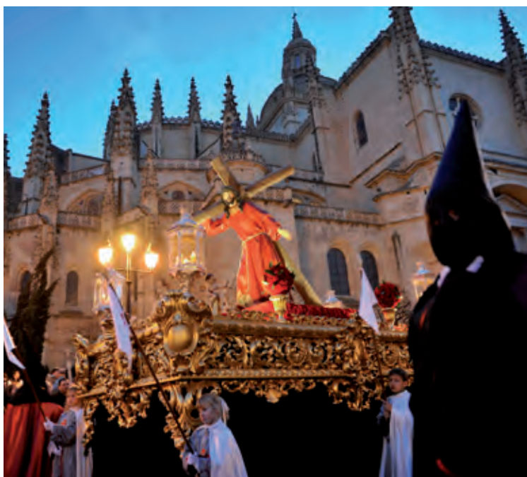
Semana Santa de Segovia.

Castilla y León cuenta con más de un centenar de fiestas declaradas de interés turístico regional, nacional e internacional.